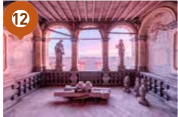
Balcon de l'Adour : Francis MESLET - Mindstravels (Lieux abandonnés)