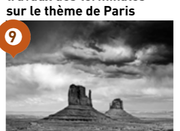
Allées du Casino : Stéphane DELPEYROUX L'ouest américain