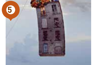
Place de l'Ecarteur : Laurent CHEHERE Flying houses