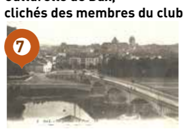
Berges de l'Adour : Travaux de deux classes de l'école élémentaire Badinter