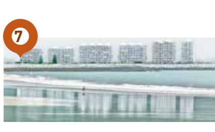
Berges de l'Adour : Concours photo numérique Solitude